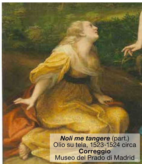
Noli me tangere (part.) Olio su tela, 1523-1524 circa Correggio Museo del Prado di Madrid