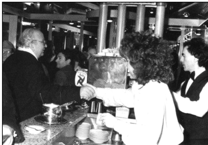
Il Presidente del Senato Giovanni Spadolini saluta i titolari del "Beppe Bar".