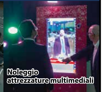
Noleggio attrezzature multimediali