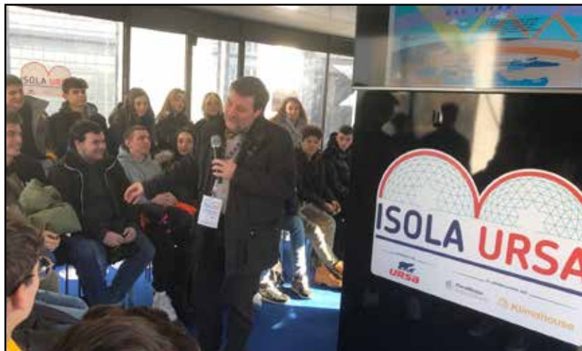
Il Climatologo Dott. Luca Mercalli durante l'edizione 2020

Promotrice e sostenitrice del progetto ISOLA URSA è URSA Italia , azienda leader nella produzione di materiale volto all'isolamento termico ed acustico degli