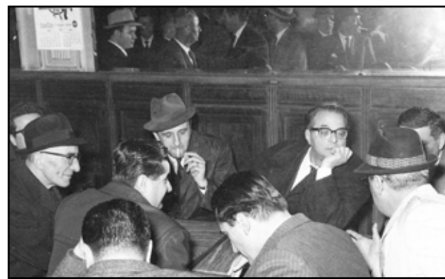
La Malfa al Caffè Italia