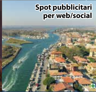
Spot pubblicitari per web/social