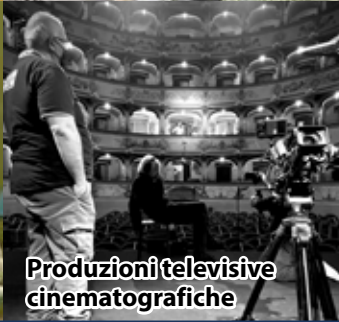
Produzioni televisive cinematografiche