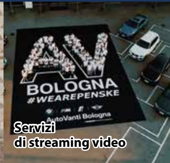
Servizi di streaming video