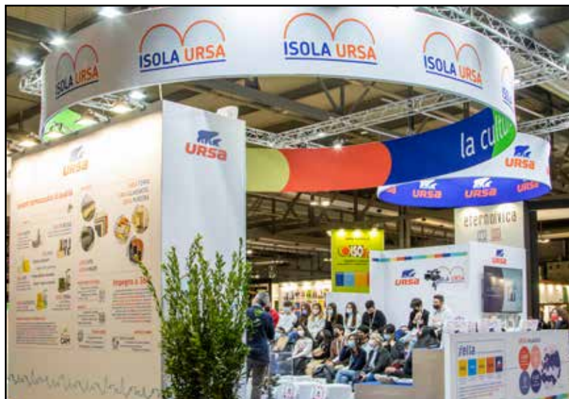
ISOLA URSA al MADE EXPO di Milano 2021

Il secondo allestimento sarà invece collocato all'ingresso della Fiera Klimahouse, Galleria Centrale, Livello 0 , e ogni giornata ospiterà un doppio appuntamento con le visite guidate all'esposizione di tre progetti di architettura sostenibile , selezionati per i virtuosismi delle soluzioni tecnologiche adottate e curati da importanti Studi di progettazione. Oltre a questo, attività interattive sul tema della progettazione sostenibile e momenti di orientamento universi-