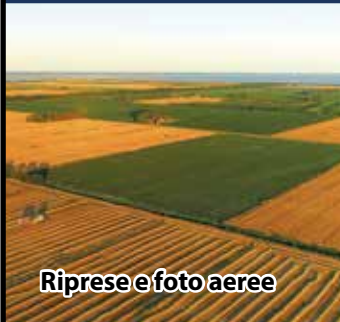
Riprese e foto aeree

Casa di produzione Video e cinematografica Servizi fotografici Noleggio: attrezzature foto-video e sistemi interattivi e multimediali