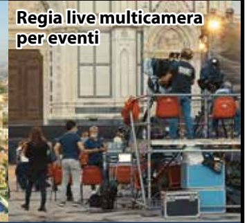
Regia live multicamera per eventi