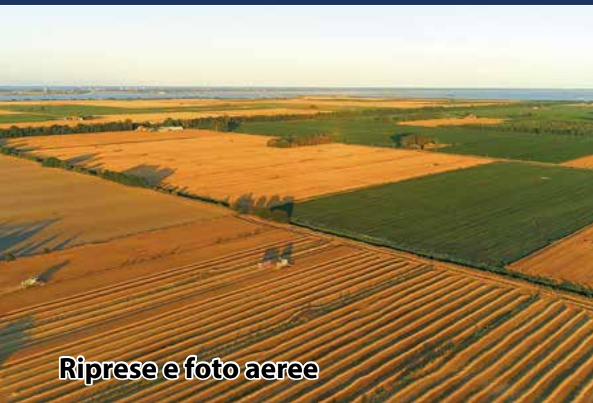
Riprese e foto aeree

Noleggio: attrezzature foto-video e sistemi interattivi e multimediali