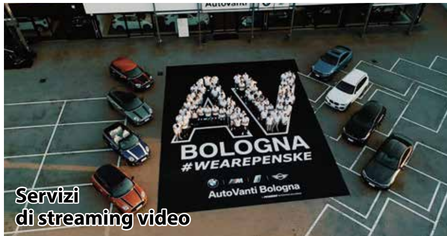
Servizi di streaming video