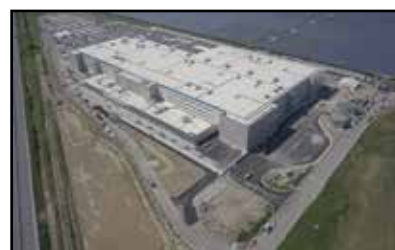
Centro di distribuzione di una nota multinazionale di e-commerce in provincia di Rovigo

idea possiamo riferire esempi dove questa strategia ha funzionato. La Provincia di Modena anziché portare la manodopera dall'Appennino alle zone delle ceramiche, ha portato le ceramiche nei Paesi dell'Appennino, evitando così lo spopolamento di questi paesi. La Regione Veneto ha creato le condizioni affinché alcune realtà imprenditoriali si insediassero nella Provincia di Rovigo, in zone definite "deprese"; ne è esempio la recente apertura di un centro di distribuzione di una nota multinazionale di e-commerce nella nuova realtà di San Bellino, dove sono stati assunti 1.400 dipendenti, con la conseguente crescita di un indotto e di una Provincia considerata povera.