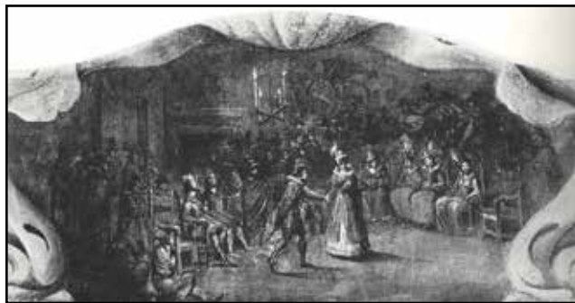
Carnevale di Berlingaccio

in cui si potesse verificare, anche solo temporaneamente, una situazione di uguaglianza sociale.