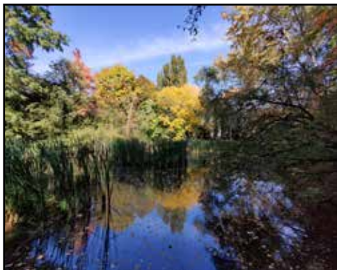
Bosco Integrale

"Sono molto felice di aver costituito la Fondazione, insieme alla mia famiglia e di aver fatto un ulteriore passo all'interno del progetto in ricordo di mia