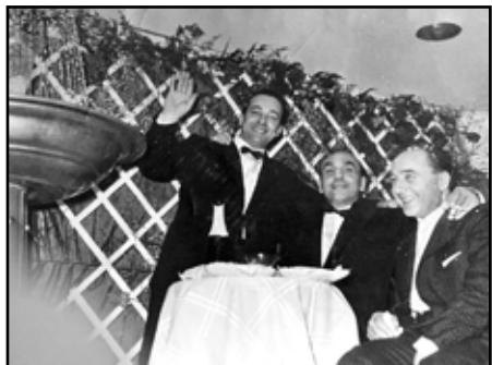
Veglione del Martedì