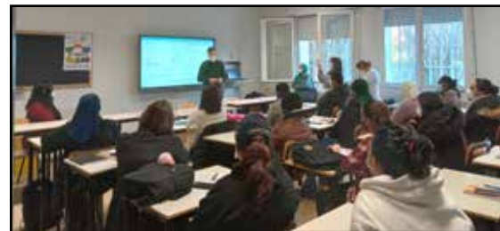
CPIA (Centro per l'istruzione degli adulti)

con l'attivazione del progetto fra Amministrazione comunale e Ausl: arrivare a vaccinare anche tutti coloro che si trovano in uno