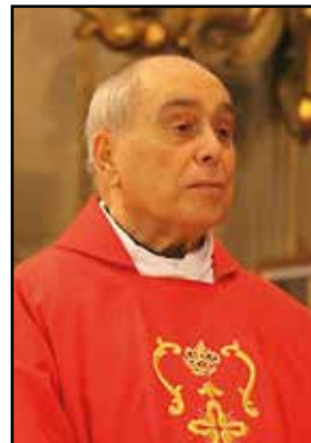
Monsignor Salvatore Baviera