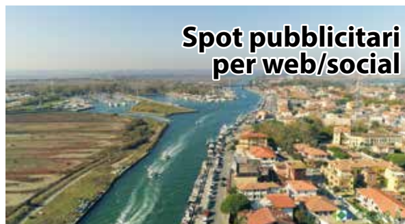
Spot pubblicitari per web/social