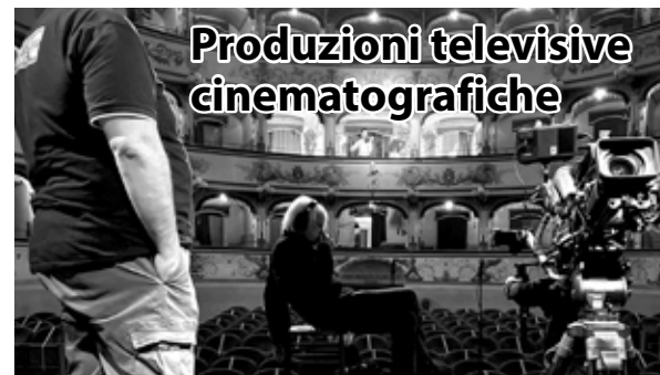
Produzioni televisive cinematografiche