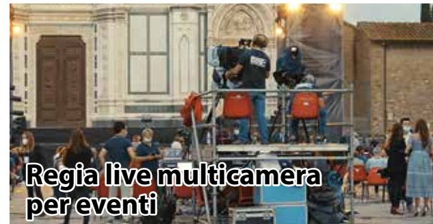
Regia live multicamera per eventi

Preventivi gratuiti Tel. 0532 453587 - www.civettamovie.it info@civettamovie.it