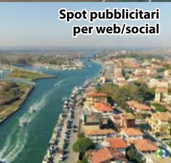
Spot pubblicitari per web/social