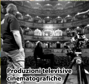
Produzioni televisive cinematografiche