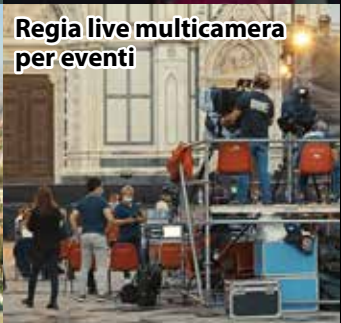
Regia live multicamera per eventi