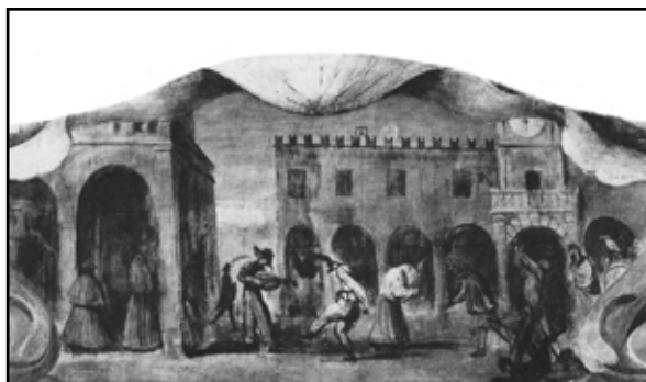
Carnevale del Guercino