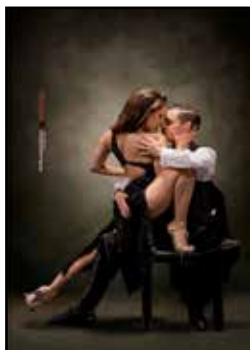
Tango Rouge Company

prende vita uno spettacolo che è una vera Babilonia di musica, teatro e creatività. Lo spettacolo di questo straordinario performer, non ha confini, piace ovunque, a un pubblico assolutamente eterogeneo dai 7 ai 70 anni. "teatro comico"