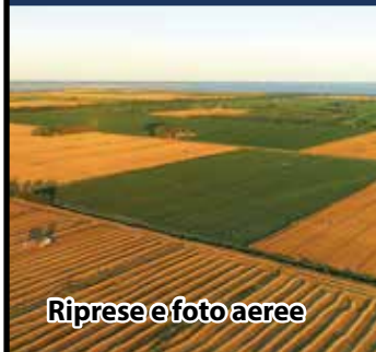
Riprese e foto aeree

Noleggio: attrezzature foto-video e sistemi interattivi e multimediali