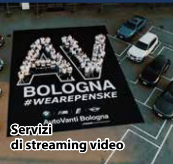
Servizi di streaming video