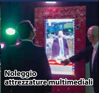
Noleggio attrezzature multimediali