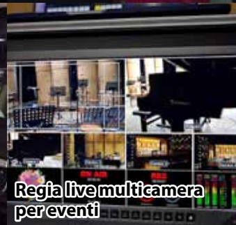
Regia live multicamera per eventi