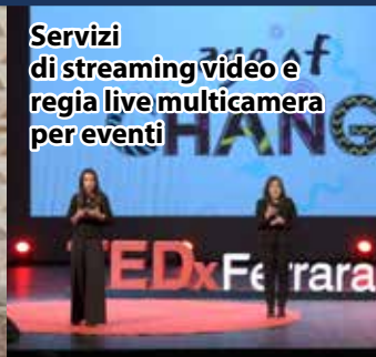
Servizi di streaming video e regia live multicamera per eventi