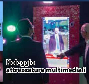
Noleggio attrezzature multimediali