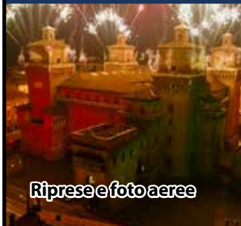
Riprese e foto aeree

Casa di produzione Video e cinematografica Servizi fotografici Noleggio: attrezzature foto-video e sistemi interattivi e multimediali