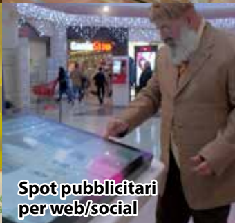
Spot pubblicitari per web/social