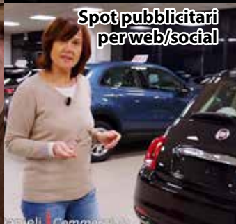
Spot pubblicitari per web/social