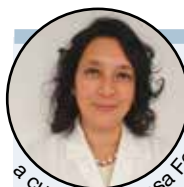
a cura della Dr.ssa Federica Zurlo

Per prenotazioni e informazioni scrivere via e-mail info@golfcento.com oppure telefonicamente al 329 1758044 o al 348 3513050