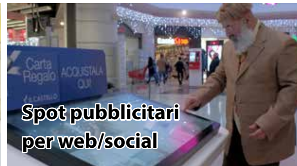
Spot pubblicitari per web/social

Reparto di Cardiologia Un reparto di degenza moderno, funzionale ed efficiente, dotato di sistemi di monitoraggio avanzato per la sicurezza dei pazienti.