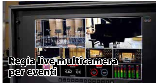
Regia live multicamera per eventi