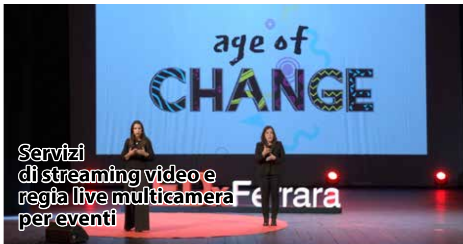
Servizi di streaming video e regia live multicamera per eventi