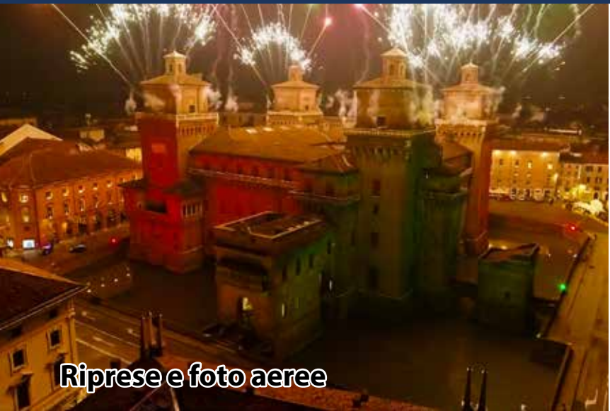
Riprese e foto aeree