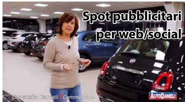
Spot pubblicitari per web/social