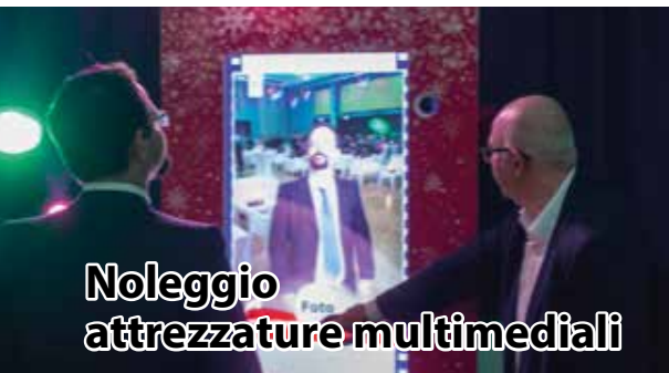
Noleggio attrezzature multimediali