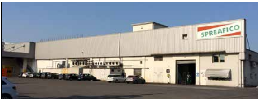
La sede di Santa Maria Codifiume