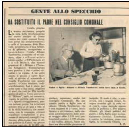
Pagina interna di GENTE del 1952

commosso a una donna concreta, determinata, dal grande senso delle istituzioni e della comunità. La sua è stata una vita spesa per l'impegno politico in senso più nobile. Inteso come servizio, per gli altri come individui e per la Città tutta. Ha ereditato la passione civile del suo grande padre, Albano Tamburini (socialista, al contrario di lei ndr) ,