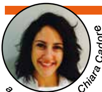
a cura Dott.ssa Chiara Cadore