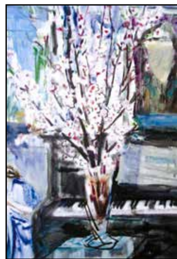
Fiori di pesco

cata, non se ne seppe più nulla e i quadri sparirono. Di qui la richiesta di spiegazioni al Comune, sempre