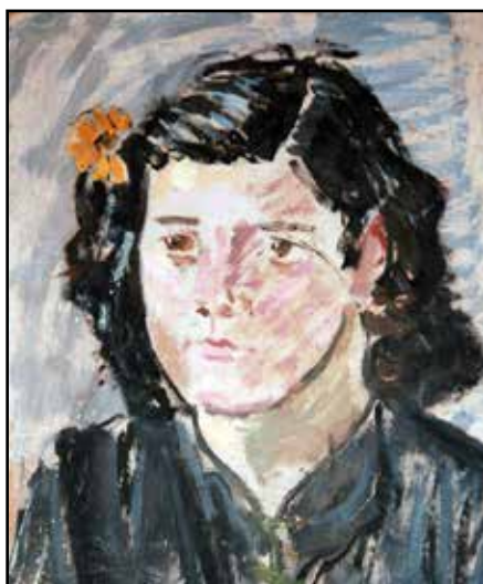
Ritratto di ragazza