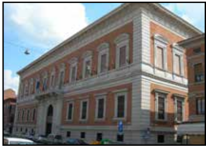
Sede Carife a Ferrara, in Corso Giovecca