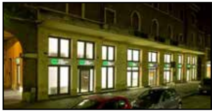
Caricento, filiale di Viale Cavour

ne va degli investimenti dei 9.000 soci e del futuro di un'intera comunità sociale e imprenditoriale.