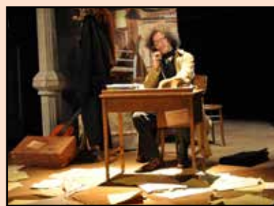
Simone Cristicchi in "Magazzino 18"

Venerdì 6 febbraio ore 21.00 il cartellone L'altro Teatro propone lo spettacolo dal titolo "Magazzino 18" di e con Simone Cristicchi.