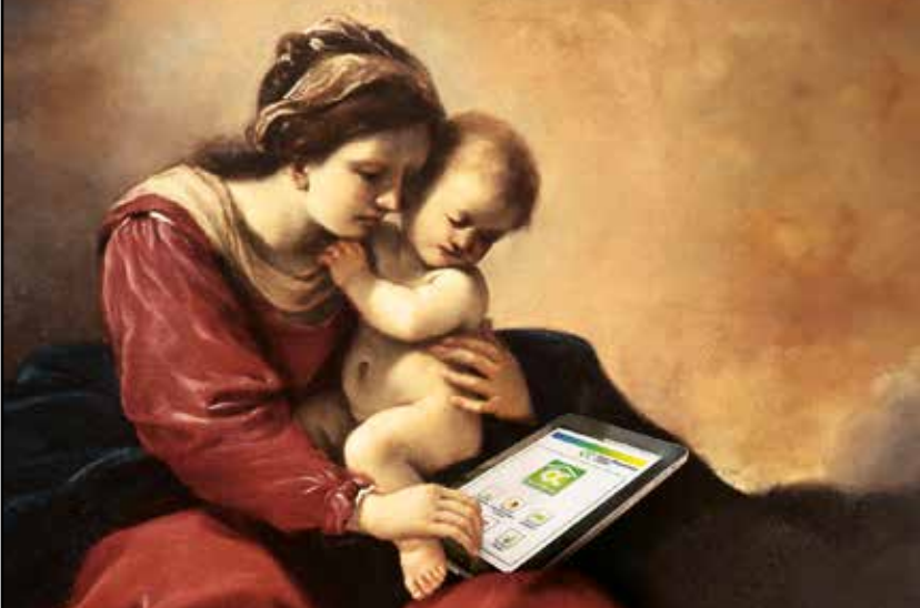
Particolare del quadro del Guercino "La Madonna del Carmine con i Santi Alberto, Francesco e un francescano" gentilmente concesso dalla Pinacoteca del Comune di Cento.

Da oltre 150 anni crediamo nella nostra terra, nelle persone che la vivono e nelle imprese che la rendono produttiva. La loro storia è anche la nostra, che ancora una volta parla di una Banca solida, sempre più tecnologica, capace di creare valore senza rinunciare ai valori.