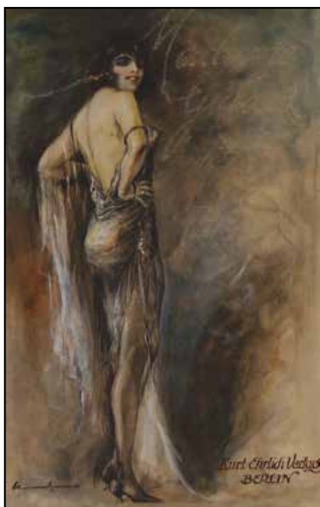
Ludwing Lutz Ehrenberger Madame Gudard Berlino 1912 . Tempera su carta cm 20x30 copia

Il percorso espositivo è scandito da una ricca selezione di materiale fotografico e documentario, che traccia una lettura tematica di apertura internazionale, intorno ad alcuni capolavori molto noti, come il dipinto Il Cappellino azzurro di Giovanni Boldini, o quasi del tutto inediti, come le illustrazioni a tempera di Lutz Ehrenberger, che ereditano lo spirito della Belle Époque e lo