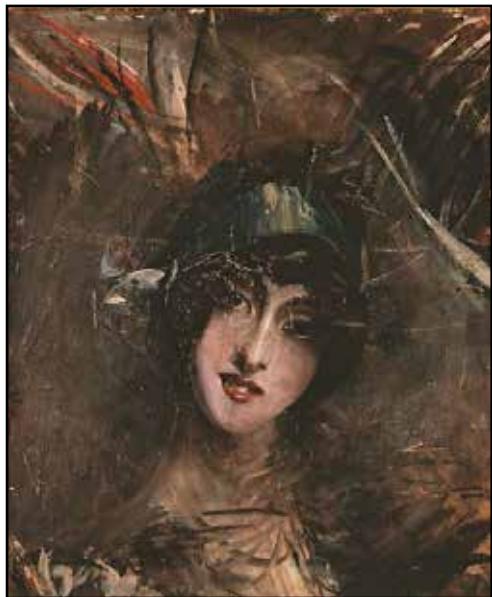
Giovanni Boldini Il cappellino azzurro , sd, olio su tela, cm 46x55

L'immagine della donna e tutto ciò che evoca l'idea di "eterno femminino" sono così ripercorsi visivamente attraverso dipinti, incisioni, manifesti, e da piccole sculture di raffinato gusto borghese, realizzato da artisti della Scapigliatura lombarda e altri plasticatori del periodo tra i due secoli, alle quali è dedicata un'ampia ricognizione. Uno spazio particolarmente significativo è poi riservato alle riviste illustrate, pubblicazioni molto diffuse con cui collaboravano i migliori autori dell'epoca, contribuendo in maniera fondamentale alla diffusione di modelli di bellezza e comportamento più spregiudicati e seduttivi. In questa ampia ricognizione sulle principali riviste europee, figura un rarissimo esemplare di Le Rire del 1895-96 che contiene alcune delle più ricercate litografie di Toulouse-Lautrec .