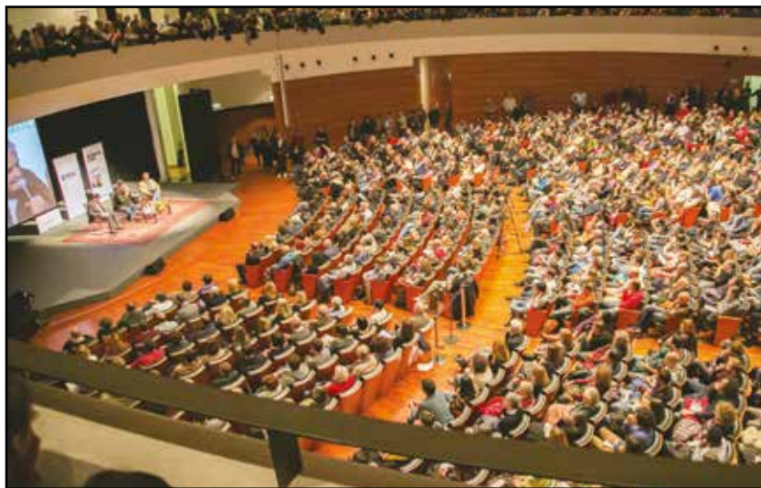
BPER Forum Guido Monzani a Modena