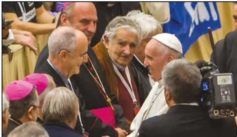
Mujica e papa Francesco