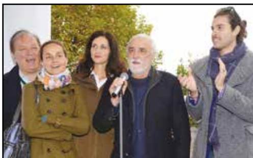
Foto di gruppo del CDA