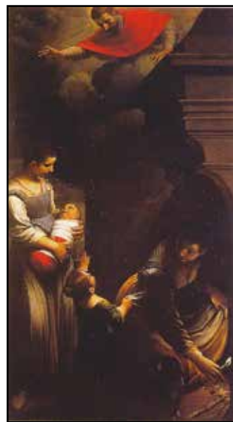
Guercino. Il Miracolo di S. Carlo Borromeo Olio su tela, cm. 217 x 117 Renazzo, Chiesa di S. Sebastiano

offrono l'occasione di ricordare il santo attraverso un bel dipinto giovanile (1613-14) del Guercino che ne rappresenta un miracolo. Il quadro mostra due momenti distinti, il miracolo che risana la bambina e il riconoscimento successivo. La scena si svolge in un ambiente domestico e nell'intimità familiare, che si coglie negli sguardi affettuosi tra la madre e la figlia, nel gesto materno di stringere a sé la bambina, nella presenza del gatto di casa. Un grande camino è l'unico arredo distinguibile,