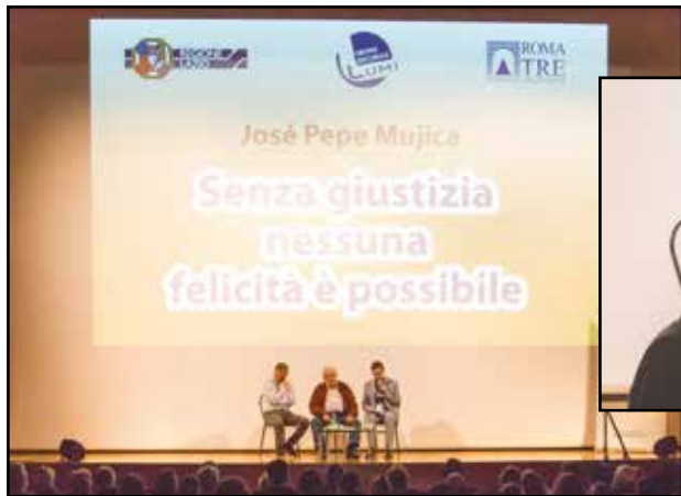
Incontro Roma, dal Palco del Teatro Palladium Sabato 5 novembre