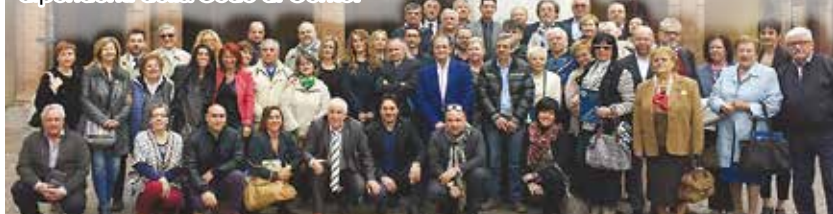
Foto di gruppo degli imprenditori premiati a Cento, in occasione del 70esimo anniversario della Cna, insieme alle autorità, ai dirigenti e alle dipendenti della Sede di Cento.