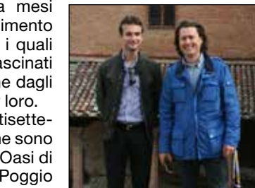
Lamborghini Jr e Manservisi