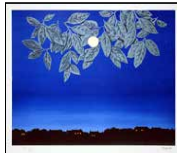
Magritte. La pagina bianca

del Comune di Ferrara, ha proposto un viaggio nell'immaginario della cultura popolare. Storicamente, quando l'uomo guardava la Luna e le sue macchie, ha sempre intravisto qualcosa, oggetti o volti. Nella catalogazione delle fiabe, compare la categoria "omino sulla Luna" per identificare quegli "esseri" che, per le colpe commesse, dalla Terra sono stati spediti sulla Luna. Il personaggio principale è Caino, immortalato