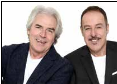
Tullio Solenghi e Massimo Lopez