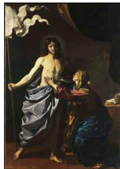
Cristo appare alla madre

Due saranno le sedi di mostra: la Chiesa di San Lorenzo e il Castello