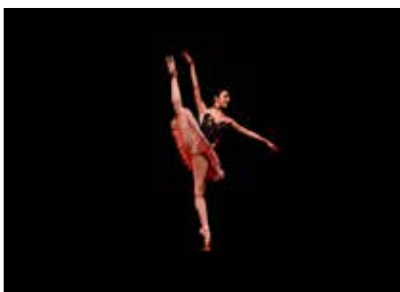
Pas De Deux Gala