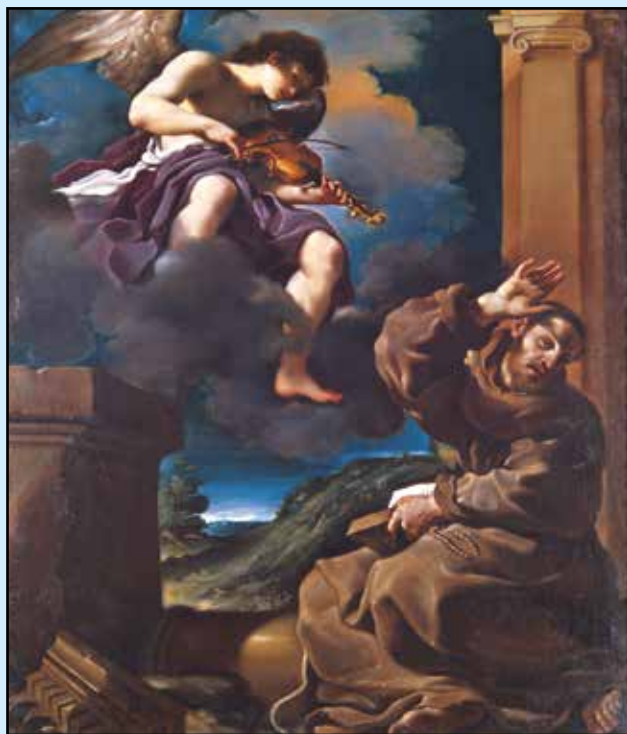
Estasi San Francesco

Un'importante "sorpresa" della mostra, sarà rappresentata dalla proiezione di un breve video che illustra il primo bellissimo fregio realizzato dal Guercino nel 1614 in Casa Provenzali (oggi Benazzi), riportato finalmente alla luce, dopo essere stato per lunghissimo tempo nascosto alla vista, in quanto coperto