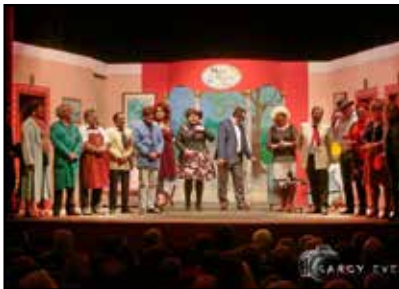
I Centesi di Ardin