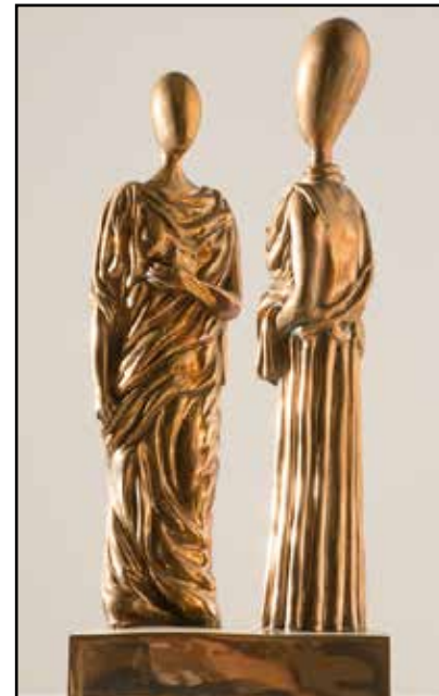
La musa inquietante

pregevoli opere grafiche, il museo propone un allestimento che intende mettere in relazione le rappresentazioni bidimensionali e la loro restituzione a tutto tondo: ricorrono alcune