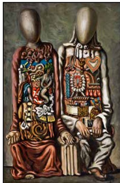
Manichini coloniali 1959

Per presentare al pubblico un importante nucleo composto da 19 di queste sculture, recentemente acquisite nella collezione permanente del MAGI'900, unitamente a