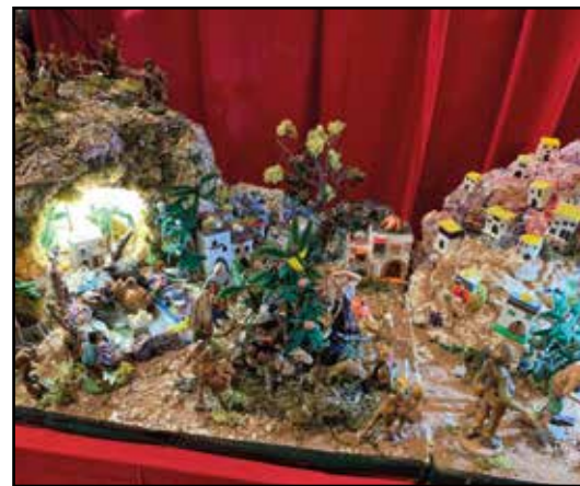
In alto e a sx Santa Maria di Venezzano