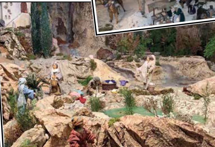
In alto e a sx Bondeno