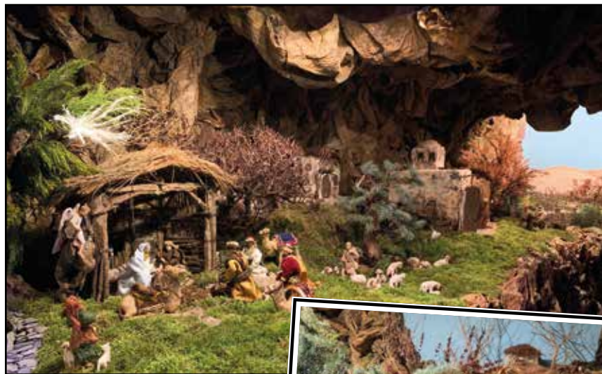
In alto e a dx Bevilacqua