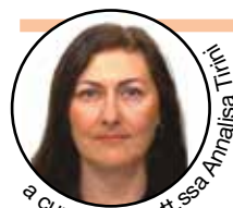
a cura della Dott.ssa Annalisa Turchi

È stata prorogata fino al 31 dicembre 2017 la detrazione irpef del 50% dell'iva pagata sull'acquisto di unità immobiliari residenziali. L'intento del legislatore è quello di ridurre la crisi nel settore edilizio incentivando le vendite immobiliari. L'agevolazione consiste nella riduzione dell'irpef pari al 50% dell'iva pagata al momento dell'acquisto dell'immobile, attraverso i dichiarativi fiscali redditi e 730. Chi si trova nella necessità di acquistare casa o effettuare un investimento immobiliare, può valutare di rispettare i requisiti richiesti per ottenere l'agevolazione.