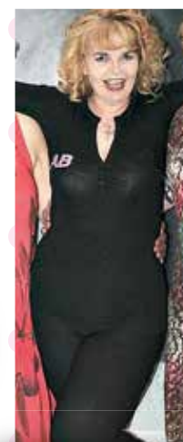
DOPO IL TRATTAMENTO