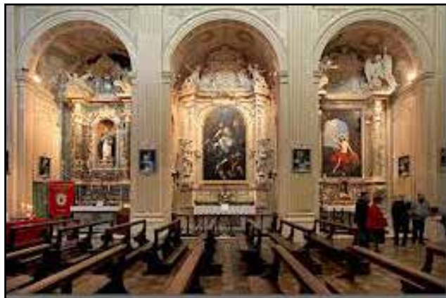
Lo splendido interno della Chiesa del Rosario.

anche guardati. C'è sempre anche nell'esperienza sensibile una esperienza della trascendenza, in quanto vedo anche quello che non vedo e che va oltre il campo visivo dell'immagine, in modo simile, come scriveva S. Agostino, al cammello che passa davanti alla finestrella della torre, e che il prigioniero continua a vedere (e udire) anche dopo che è passato. Le tante immagini di Cento e dintorni svelano un popolo che ha bisogno di "vedere". Il che fa pensare all'arte dell'icona, nata dal desiderio di vedere il vero volto di Cristo, anticipando il momento in cui, come dicono gli Atti: "lo vedrete tornare così come lo avete visto salire al cielo", oppure di vedere il volto di Dio, come esclama Giobbe nelle sue sofferenze: "con questi miei occhi vedrò il volto di Dio".