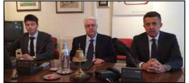
La conferenza stampa di presentazione

questa realtà industriale all'epoca decisamente innovativa. Questo imprenditore (guida la società di famiglia con i due figli) in definitiva è stato un vero pioniere nel settore