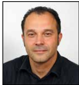
foto) assessore alla Sostenibilità Ambientale - e constatare l'ottimo risultato che il nostro comune ha raggiunto in pochissimo tempo è ovviamente motivo di grande soddisfazione».

Legambiente ha recentemente presentato la VI Edizione di "Comuni Ricicloni dell'Emilia-Romagna" che premia i migliori risultati conseguiti nel 2012 dalle amministrazioni comunali in tema di gestione dei rifiuti urbani. Persiceto è premiato tre volte: è arrivato al primo posto con la miglior percentuale di raccolta differenziata (73,10%) e con la miglior raccolta dell'organico (132 Kg/Ab) e al secondo posto per il minor smaltimento dei rifiuti in discarica (121 Kg/Ab). I dati si riferiscono al 2012, ma ad oggi sono ulteriormente migliorati dal momento che la differenziata a Persiceto raggiunge l'80%.