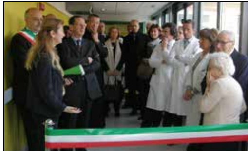
Un momento dell'inaugurazione della Terapia Intensiva ed Area Medica

Ferrara per questo ulteriore obiettivo che è stato raggiunto "un'altra tappa di un percorso che dovrebbe terminare fra circa due anni e che porterà alla completa ristrutturazione dell'Ospedale di Cento con la realizzazione del nuovo Pronto soccorso. Siamo di fronte non solo a un miglioramento dell'ospedale ma soprattutto ad un nuovo modo di lavorare, un approccio specialistico diretto da alte professionalità".