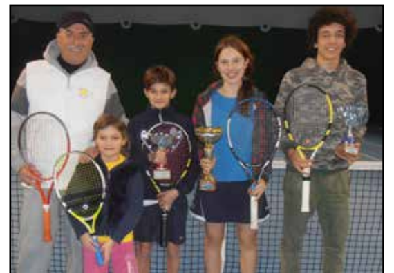
Premiazione Tornei CT Sala e Bazzano