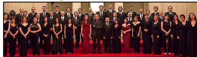
Foto di gruppo del Concerto di Capodanno

La stagione teatrale centese 2014 è stata inaugurata col successo del concerto di Capodanno che si è tenuto nella suggestiva cornice dell'Auditorium San Lorenzo. Iniziare con un grande concerto lirico