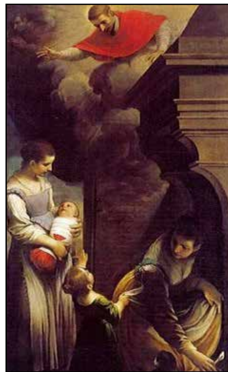
"Un miracolo di S. Carlo Borromeo",